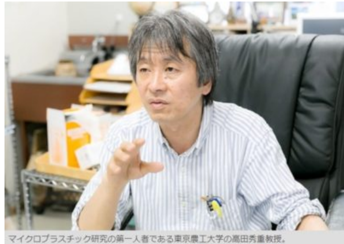
マイクロプラスチック研究の第一人者である東京農工大学の高田秀重教授。

東京農工大学 農学部 環境資源科学科 教授。 専門は環境中の合成洗剤、医薬品・抗生物質、PCBなどの環境汚染の研究。1998年からプラスチックと環境ホルモンの研究を開始。2005年以来 International Pellet Watch を主宰。2015年に「マイクロプラスチックによる海洋汚染の研究及び海洋環境保全への貢献」で海洋立国推進功労者表彰内閣総理大臣表彰を受賞。クレヨンハウス社「プラスチックモンスターをやっつけよう!」、東京書籍「プラスチックの現実と未来へのアイデア」などを監修。